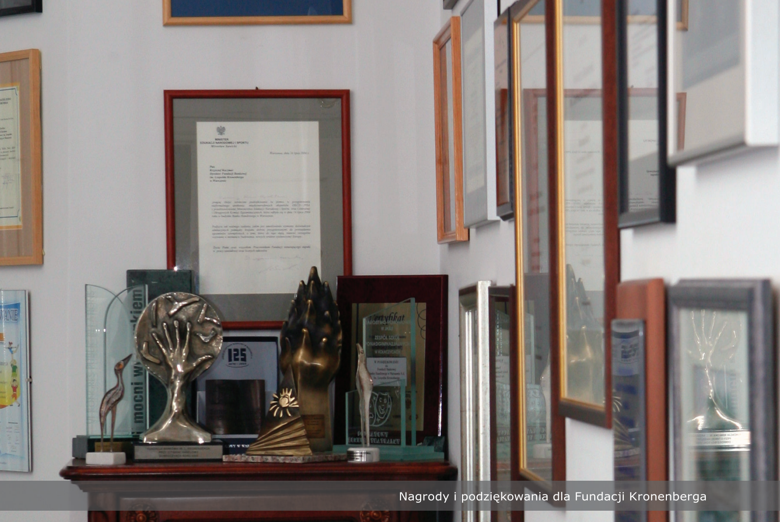
Nagrody i podziękowania dla Fundacji Kronenberga

Przedsięwzięcia planowane przez Fundację na rok 2007 są efektem zmian programowych w działalności Fundacji, określonych w toku wzajemnych uzgodnień między Zarządem i Radą Fundacji a władzami Citigroup Foundation. Założenia planu pracy Fundacji w roku 2007 stanowią w dużej mierze naturalną kontynuację założeń planu z roku ubiegłego. Utrzymana zostanie formuła finansowania kosztów programowych Fundacji.