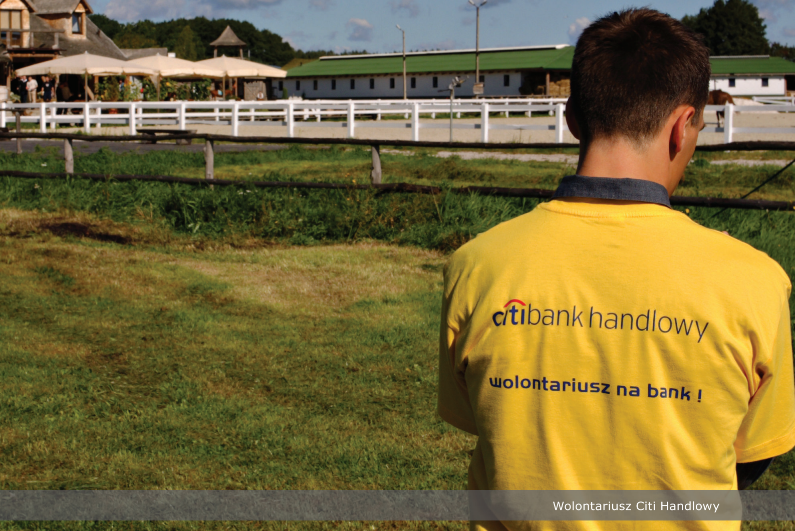
Wolontariusz Citi Handlowy